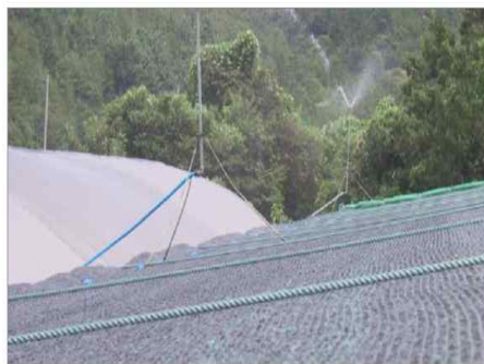
<축사 지붕 위 물 분사>

- 축사 지붕위로 물을 분사하여 복사열을 감소시킴으로써 축사 내부온도를 일정부분 낮출 수 있음