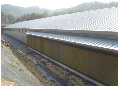
<쿨링 패드 가동장면>