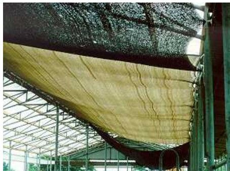
<축사지붕 및 축사 내 차광막 설치>