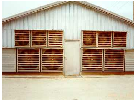
<계사 환기팬 설치>

※ 축사 내 환기팬 또는 송풍팬의 설치는 풍속을 증가시켜 가축의 체감온도를 낮출 수 있을 뿐 아니라 젖소의 경우 산유량도 증가시킴(표 3)