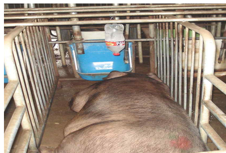
<페트병을 활용한 점적관수>