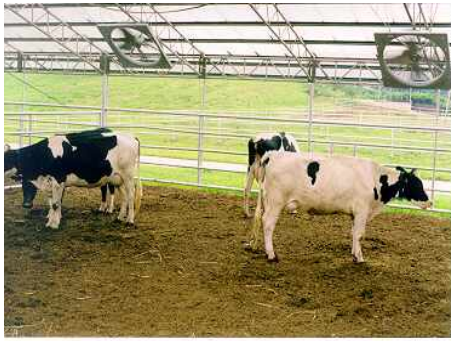
<우사 송풍팬 설치>