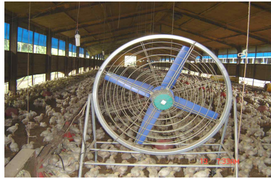
(개방 계사 릴레이 순환 팬)