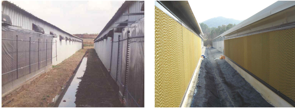
<무창계사 쿨링패드 설치>

※ 무창계사에서 쿨링패드 설치에 의한 계사내부 온도는 외부온도가 33℃일 경우 입기온도는 27.4℃이고 배기구의 온도는 29.8℃로 감소하지만 습도는 다소 높아짐(표 4).