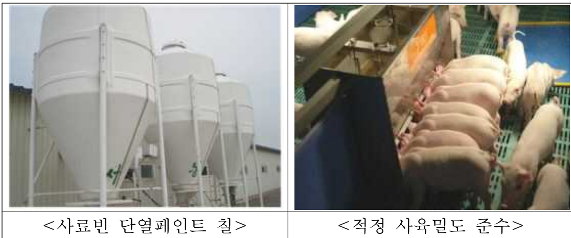
<표 2> 사육밀도별 돼지 생산성