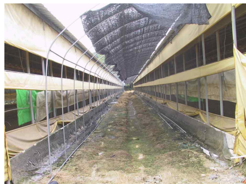
<계사 서향에 그늘막 설치>