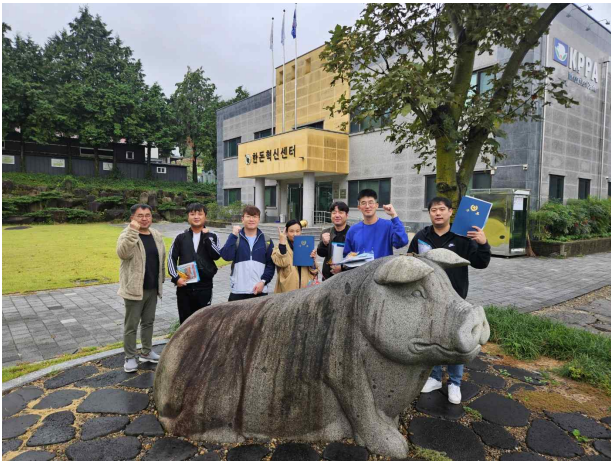
스마트양돈사양 전문과정 5기