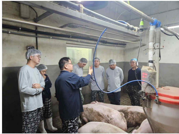
스마트양돈사양 전문과정 5기 실습