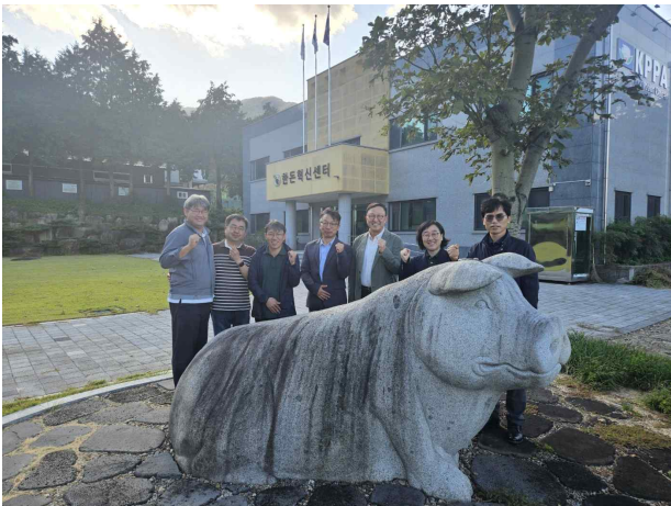
한돈팜스 업데이트 관련회의