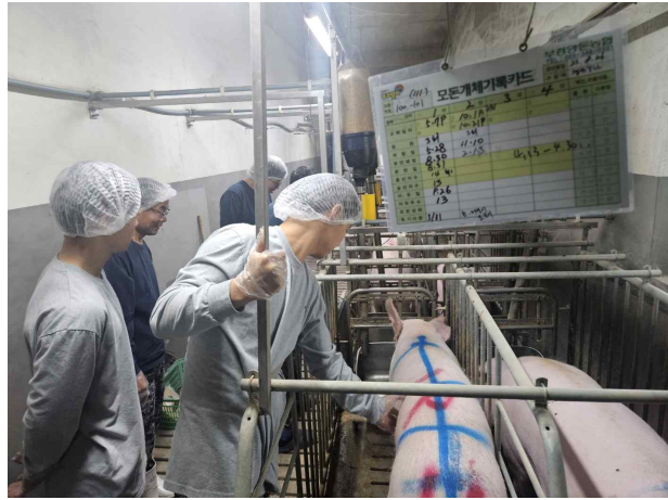
스마트양돈사양 전문과정 6기 실습