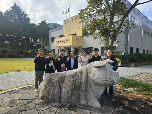
스마트양돈사양 전문과정 6기