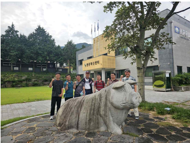
스마트양돈사양 전문과정 4기