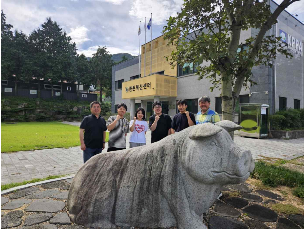
스마트양돈사양 전문과정 3기