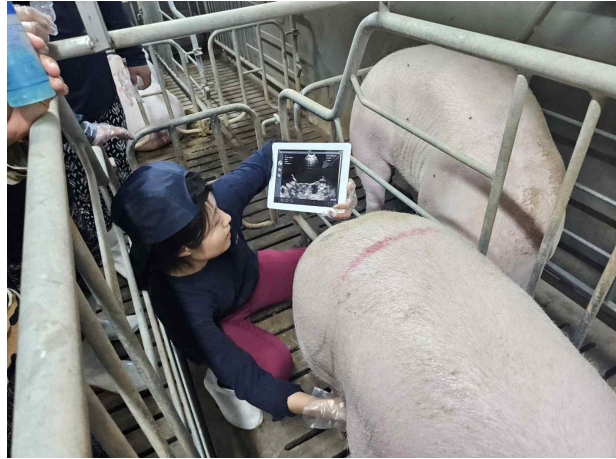
스마트양돈사양 전문과정 3기 실습