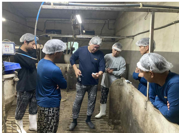
스마트양돈사양 전문과정 4기 실습