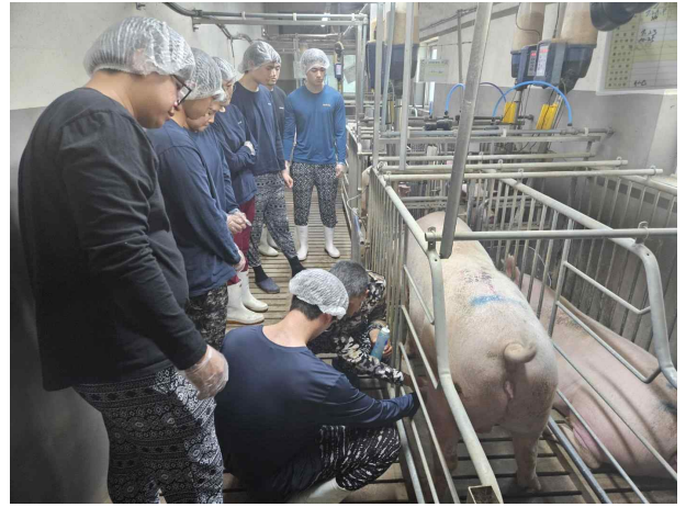
스마트양돈사육의 이해 과정(대학생) 1기