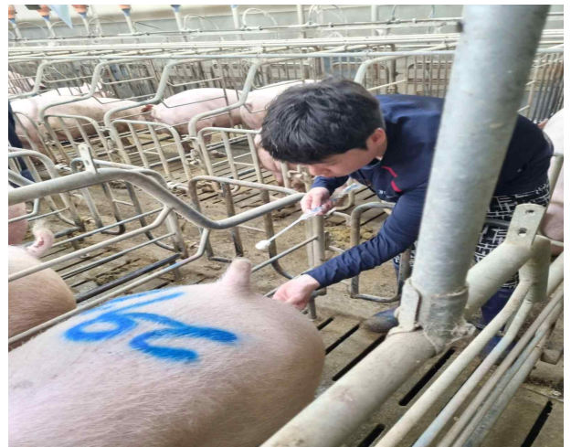
차세대축산리더아카데미 현장실습 2기