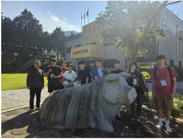
스마트양돈사육의 이해 과정(대학생) 1기