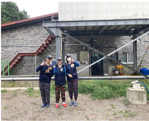
차세대축산리더아카데미 현장실습 1기