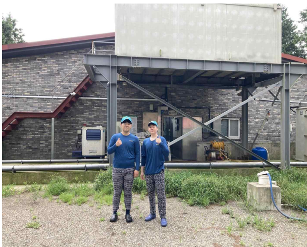
차세대축산리더아카데미 현장실습 2기