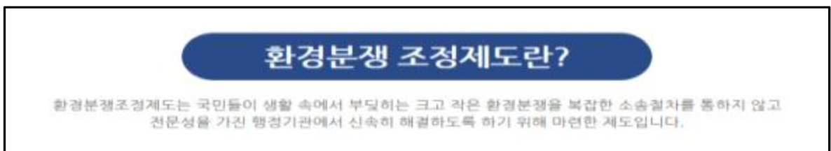
그림. 환경분쟁 조정제도 설명자료(중앙환경분쟁조정위원회)

○ 환경분쟁조정제도는 국민들이 생활 속 크고 작은 환경분쟁을 복잡한 소송절차 없이, 행정기관을 통해 해결할 수 있도록 마련한 제도