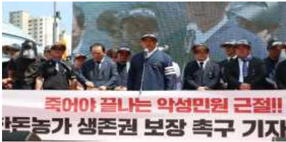
그림. 보성농가 추모제 및 기자회견(' 23. 8.)