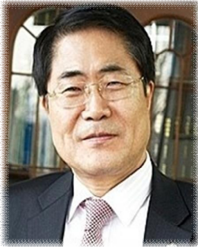
장태평 위원장 대통령소속 농어업농어촌특별위원회