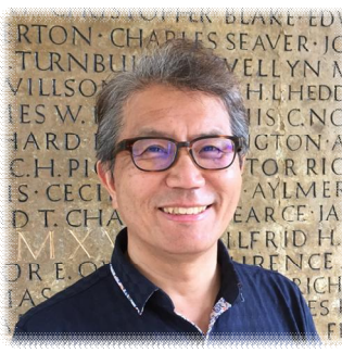
Mitsuyasu Yabe교수 일본 큐슈대학교 농업자원경제